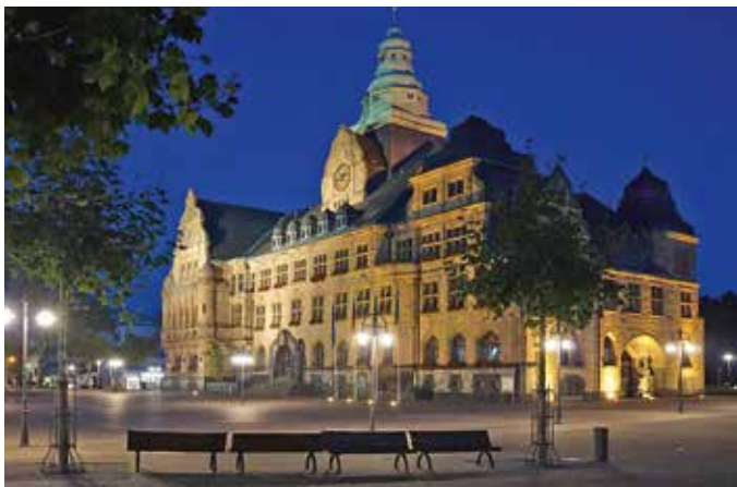
Das Rathaus: Neorenaissance in Recklinghausen

Recklinghausen liegt mit rund 120.000 Einwohnern zwischen Münsterland und der Metropole Ruhr. Bereits 1236 vom Kölner Erzbischof mit erweiterten Stadtrechten ausgestattet, ist die Kreisstadt heute das Zentrum für Handel und Dienstleistung, Kultur und Bildung. Mit ihrer historischen Altstadt und vom Wallring umgeben spiegelt Recklinghausen noch heute mittelalterliche Stadtstrukturen wider und ist gleichzeitig Mittelpunkt des urbanen Lebens im Vestischen Kreis.