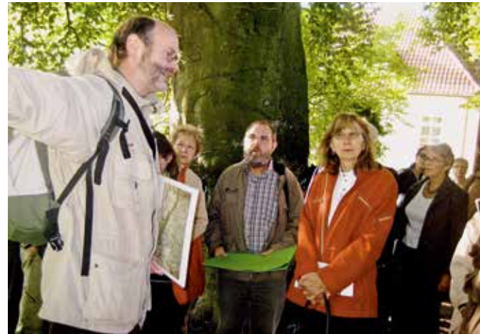
Willkommen zur Stadtführung

Herausgeber: Stadt Recklinghausen Stadtmarketing und Tourismus Tel.: 0 23 61 / 50 - 50 50 stadtmarketing@recklinghausen.de