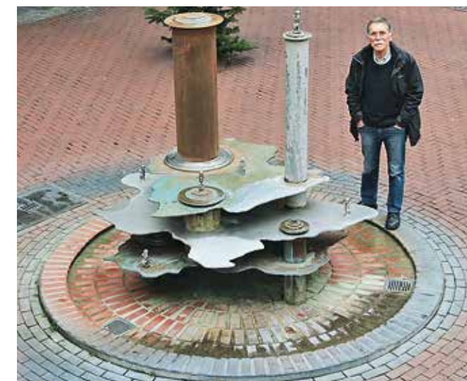
Merkwürdiges Wasser Breite Straße

Tour 8: Kunst im öffentlichen Raum Recklinghausen bietet im Stadtgebiet viele Gelegenheiten, sich Kunstwerke anzuschauen. Daher gibt es sogar zwei verschiedene Touren. Lassen Sie sich überraschen!